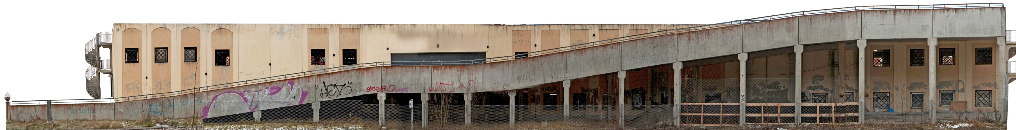
Järnvägsgatan Lindesberg Parkeringshus från öster, uppfört 1980-tal. Foto 2010