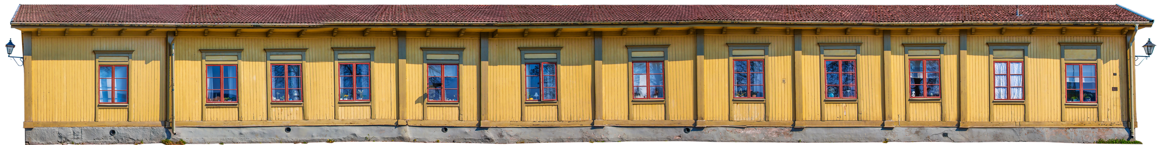
Kungsgatan 4 Lindesberg, uppfört 1700-tal. Foto 2019