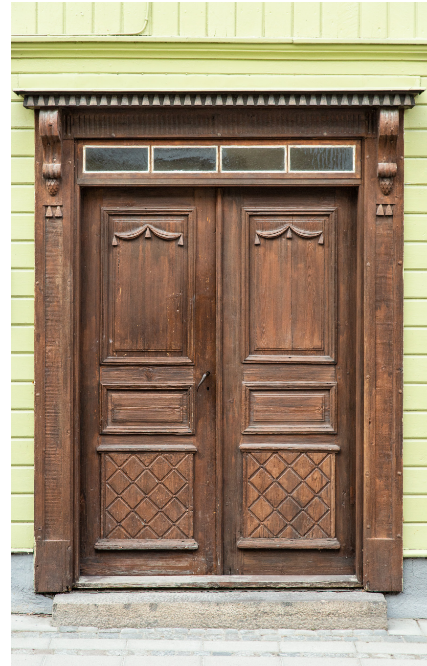
Kungsgatan Lindesberg Dörr Kungsgatan. Foto 2019