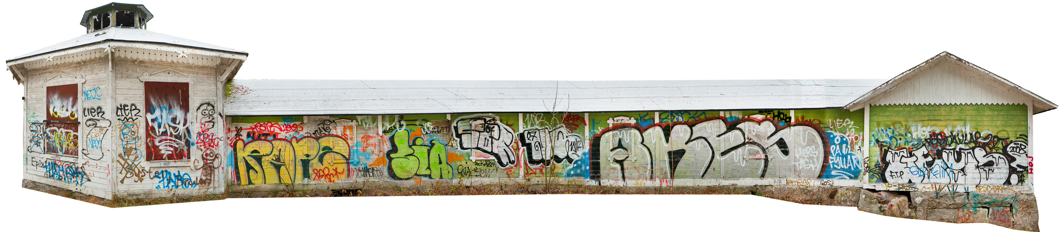
Kyrkberget Lindesberg Kägelbana, uppförd 1887. Foto 2010